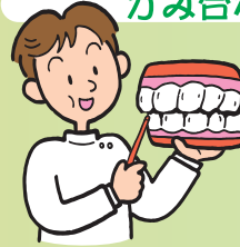
噛み合わせが悪い

偏った噛み方になってしまい、歯の周りの組織に負担がかかり炎症が起こりやすくなります。