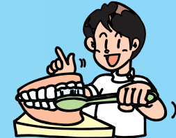
歯の磨き方が悪い

お口の中が乾燥すると粘膜が弱くなり、細菌が活発に活動するため、歯周病が進行します。