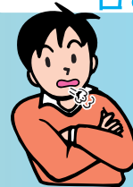
口で息をする (口呼吸)

お口の中が乾燥すると粘膜が弱くなり、細菌が活発に活動するため、歯周病が進行します。