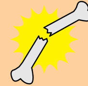
骨粗鬆症 (こつそしょうしょう)

糖分の取り過ぎや偏食、そして運動不足などの影響で、虫歯や歯周病が進みやすくなることが知られています。