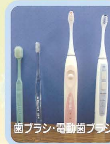
歯ブラシ・電動歯ブラシ