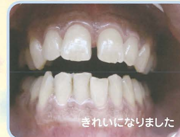
きれいになりました