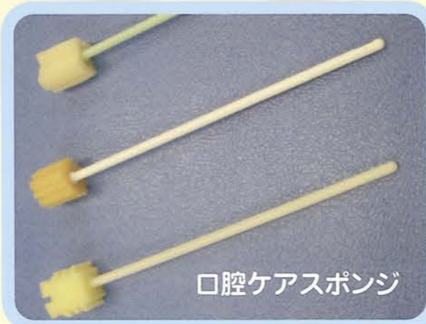
口腔ケアスポンジ